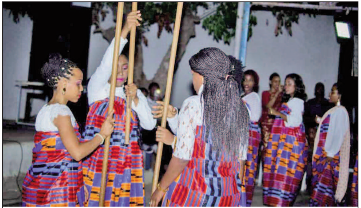
Danses traditionnelles au festival Kam Art Culture