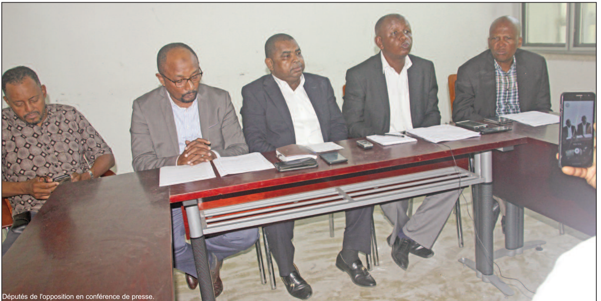
Députés de l'opposition en conférence de presse.

Les députés comoriens sont sortis de silence. Plus de deux semaines depuis la signature de l'accord-cadre entre Paris et Moroni lors de la visite officielle du président Azali Assoumani en France, les élus de la nation se sont enfin exprimés. Pour ces législateurs, lesdits accords sont « nuls et non avenue » et affirment que « Mayotte est comorienne ».