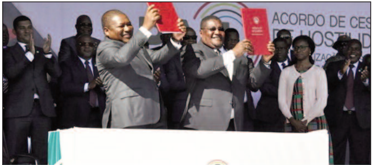
Le président du Mozambique, Filipe Nyusi, et le chef de l'opposition de la Renamo, Ossufo Momade, ont signé un accord historique mettant fin officiellement à des décennies d'hostilités militaires.

Pour poursuivre dans cette veine, avec cet accord historique, le Mozambique se place aussi dans une dynamique positive, un mois avant la visite du pape François, qui