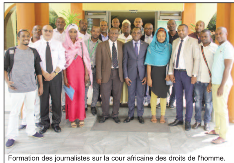
Formation des journalistes sur la cour africaine des droits de l'homme.

Le séminaire sur la sensibilisation de la Cour était aussi une occasion pour eux de rencontrer les journalistes et leur montrer les opportunités qui lui sont offertes et monter par la suite un réseau de journalistes. « A partir de cette formation, vous serez nos ambassadeurs en matière de Droit de l'Homme dans le pays », dit-il. La Cour se compose de onze juges, ressortissants des États membres de l'Union africaine. Il ressort des directives de l'UA relatives à la